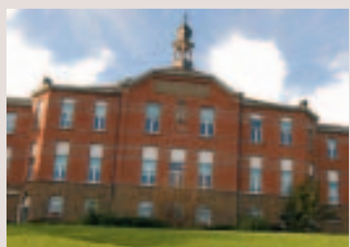
La Résidence d'Andrimont a été rénovée et est passée aux Heures Claires.