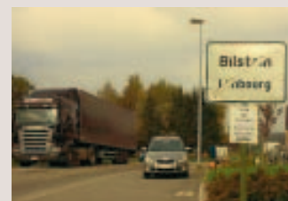
La route de contournement à Bilstain: on en est nulle part. Arch. GDS

■■ La majorité s'est retrouvée minoritaire pendant huit mois. Ça signifie pas de budget et pas de possibilité d'avancer sur les dossiers. Plusieurs promesses du programme électoral de 2006 n'ont donc pas été concrétisées: > la construction d'une route de contournement de Bilstain. Un dossier très polémique, les riverains en ayant assez de voir les gros camions passer devant chez eux. La majorité voulait la financer via la construction d'une zone artisanale, les riverains ont refusé. Ce dossier est bloqué. Il faut compter 1,5 million d'euros pour faire cette route sans compter les terrains. Des subsides sont donc indispensables;